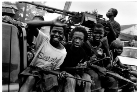
CICR/Liberia (Ref. LR-E-00067)

Además de las campañas de sensibilización para prohibir el reclutamiento de menores, el CICR procura ayudar a los niños soldados, restableciendo el contacto con sus familiares, organizando reuniones de familiares separados y, junto con otras organizaciones humanitarias, principalmente los demás componentes del Movimiento de la Cruz Roja y de la Media Luna Roja, participando en la planificación de medidas concretas de reinserción.