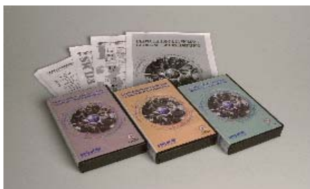
Módulo pedagógico "La explotación de la violencia"