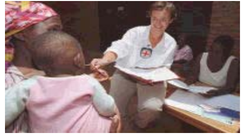
CICR/Ruanda (Ref. n° 00183)

Es necesario tomar medidas especiales para proteger a los menores detenidos. A no ser que se trate de niños muy pequeños que acompañan a su madre detenida, los menores deben ser alojados en recintos separados de los adultos y beneficiarse de una atención específica y de un sistema judicial adecuado. Cuando el CICR visita a los detenidos, se cerciora de que las autoridades respeten los derechos de los menores.