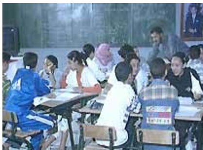
Fase piloto del programa EDH, Marruecos