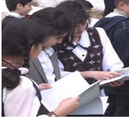
Distribución de manuales escolares del CICR en Baku (Azerbaián)