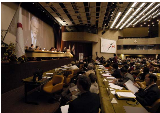
Apertura de la primera sesión plenaria de la XXVIII Conferencia Internacional de la Cruz Roja y de la Media Luna Roja (3 de diciembre de 2003)

Acción 11. Los Estados se esforzarán por mejorar la suerte de los niños que viven en circunstancias difíciles, atendiendo a sus necesidades específicas, haciendo hincapié en la prevención de la explotación sexual y física y otras formas de abuso y de la venta de niños, con el objetivo primordial de reintegrar esos niños a sus familias y a la sociedad. Los Estados harán todo lo posible por completar rápidamente la labor del Grupo de Trabajo de las Naciones Unidas encargado de elaborar un proyecto de protocolo facultativo de la Convención sobre los Derechos del Niño relativo a la venta de niños, la prostitución infantil y la utilización de niños en la pornografía.