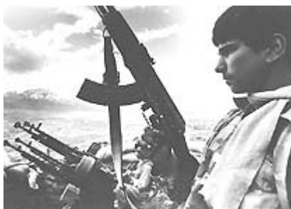
Niño soldado en Afganistán

Con respecto a los jóvenes que corren el riesgo de verse involucrados en un conflicto armado, los esfuerzos estarán encaminados a convencerles para que no se enrolen en un grupo armado. Hasta