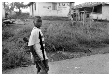
CICR/Liberia (Ref. LR-E-00063)

En cumplimiento de su cometido, basado en los cuatro Convenios de Ginebra, en los dos Protocolos adicionales y en sus Estatutos, el CICR se interesa por la suerte que corren los niños no acompañados o separados de sus familiares, los menores detenidos y los niños soldados. Se preocupa además de las necesidades médicas, materiales o psicosociales de todos los niños en general 2 .