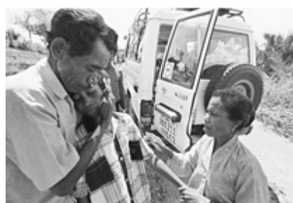
CICR/Timor (Ref. n° 00052)

Miles de padres, madres y niños están dispersos debido a una situación de conflicto armado o de violencia interna y, sin noticia los unos de los otros, viven en la angustia de saber la suerte que han corrido sus seres queridos. Tratar de aliviar este sufrimiento moral forma parte de la idea de la Cruz Roja desde su origen. Por medio de la Agencia Central de Búsquedas (ACB) 8 , el CICR desarrolla actividades para facilitar el restablecimiento y el mantenimiento de los vínculos familiares. Hoy, esta actividad sigue siendo parte fundamental de las actividades del CICR pues, a pesar del derecho vigente, en los numerosos conflictos en curso, millones de personas siguen siendo separadas y cuentan únicamente con las actividades de búsqueda y de intercambio de mensajes del Movimiento Internacional de la Cruz Roja y de la Media Luna Roja.